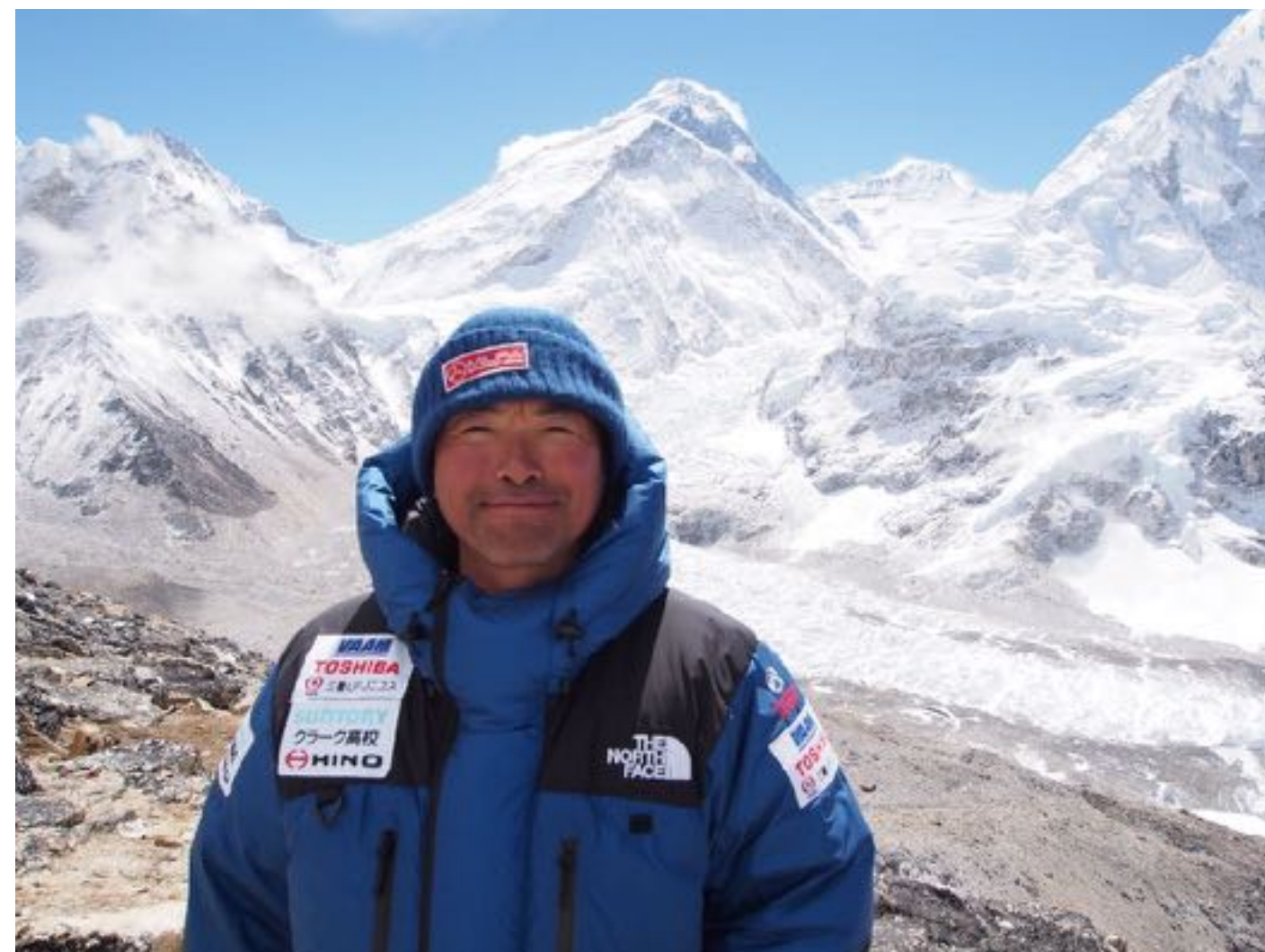
登山家 三浦豪太 様