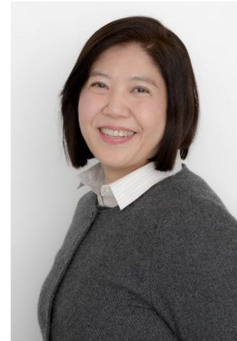
パラ・スキー 金メダリスト 東京パラリンピック 聖火ランナー 大日方邦子 様