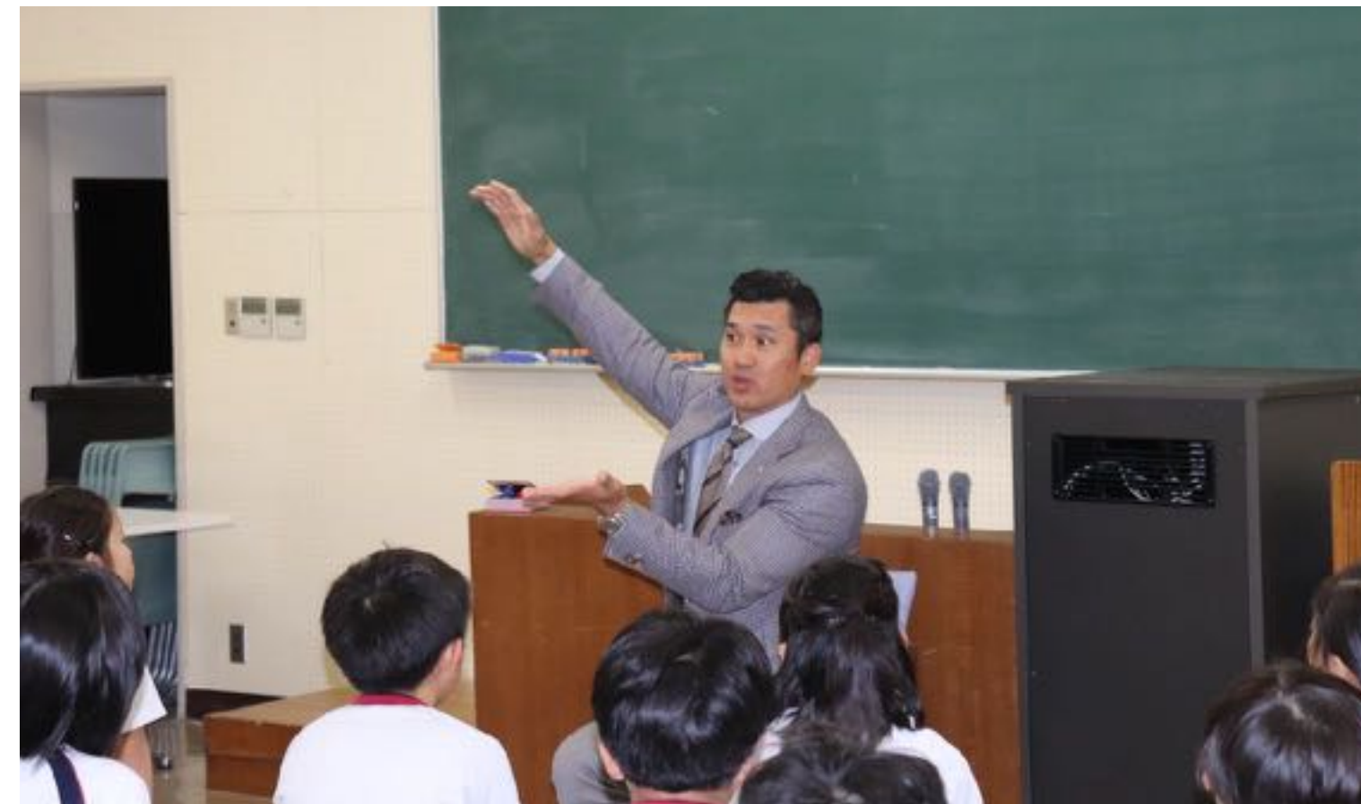
元プロ野球選手 黒木知宏 様